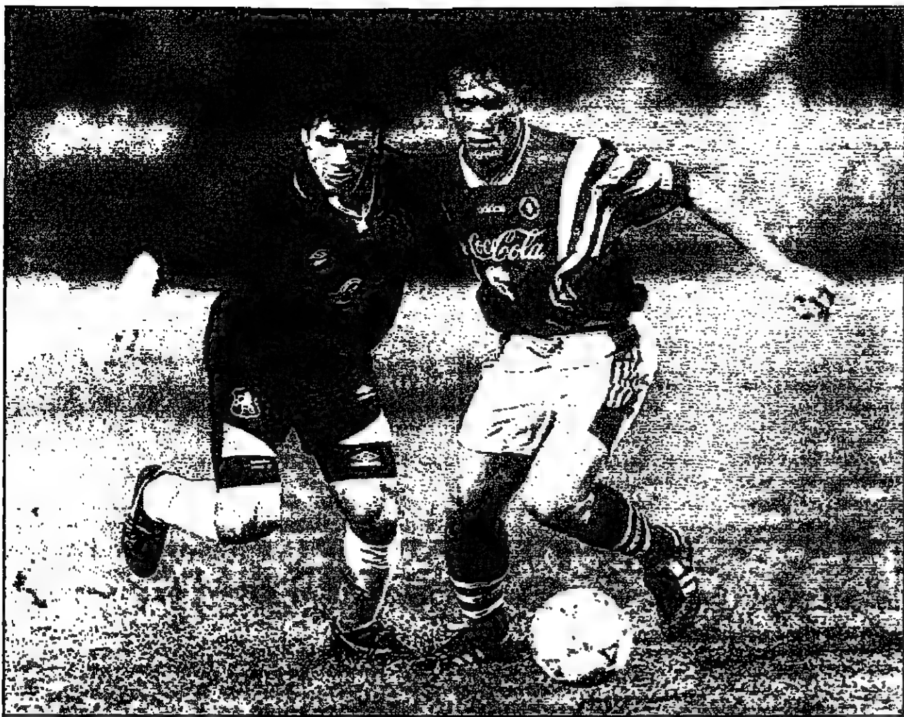
جيفرانتو كرو لولا زوب تشيلسي والى اليسار، ينافس كوكام لاعب جنوب الصين على الكرة

مانشستر (أنتلتر) - رويتز: هلم جين هودل للعب للفريق المنتخب الإنجليزي لكرة القدم روي ليفانز محارب نادي ليفربول الانكليزي بعد انسحاب لاعبي الفريق منتخب مكمانامان وروي فولر من المنتخب في مبارياته لخمس للقليل. وانتقد هودل قرار ليفانز سحب اللاعبين وقال انه مله للاستهياء خاصة بانني لم اعد الامر الى ان اعتدت تشكيل للفريق. وانسحب فولر في استجريه له عملية جراحية في الالف علاج مشكلة في التنفس بينما يعاني مكمانامان من اصابة في الركبة بحالة في راحة.